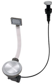
VIDAGE FADE PUSH INOX A407 A16