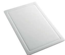
PLANCHE DE DECOUPE HDPE