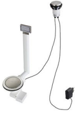
VIDAGE FADE LIGHT A407 A17